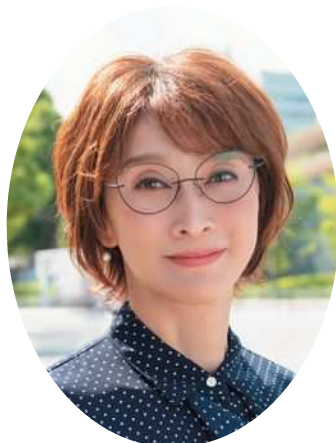
益子 直美 氏

1966年生まれ、東京都出身。 「アタックNo.1」に憧れて中学からバレーボールを始める。 1982年、名門、共栄学園高等学校に入学。 1984年、エースとしてバックアタック、ジャンピングサーブを武器に第15回春高バレー（全国高等学校バレーボール選抜優勝大会）準優勝。 高校3年時には日本代表入り。 卒業後、イトヨーカドーに入団し、1990年には当時の常勝チーム日立を破って日本リーグ初優勝に輝く。 一方、日本代表では1986、1990年世界選手権、～1989年ワールドカップで活躍。 1992年に現役を退き、スポーツキャスターとして、テレビ・ラジオ・雑誌、各種メディアなど幅広く活躍。 2015年から監督が怒ってはいけない大会（益子直美カップ）を主催。 2023年に女性として初めて日本スポーツ少年団本部長に就任（同時に日本スポーツ協会副会長にも就任）。