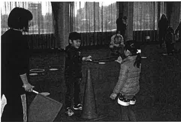
運動あそび(どんじゃん)の様子