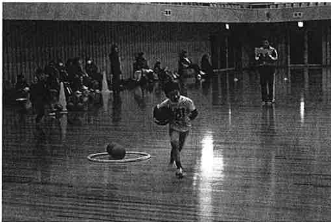
運動あそび(ボールあつめ)の様子