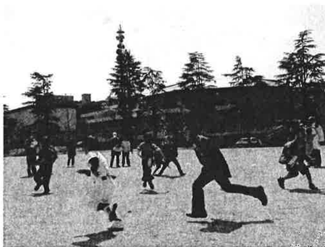
運動あそび(しっぽとりおに)の様子