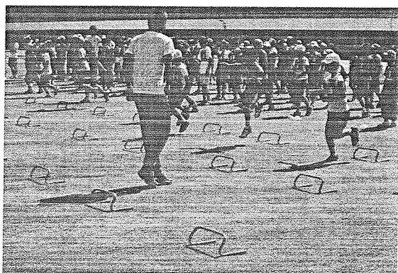
平成24年8月30日(木)愛媛県総合運動公園陸上競技場にて