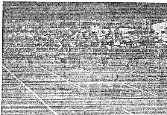
平成24年8月31日(金)西条市ひうち陸上競技場にて